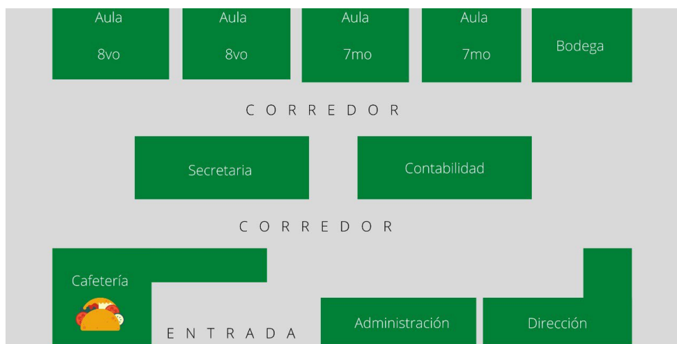
Figura 1. Croquis planta baja escuela elemental básica

La escuela es de administración privada, tiene alrededor de 21 profesionales de la educación, 5 personas en área administrativa y 5 en el área de la cafetería.