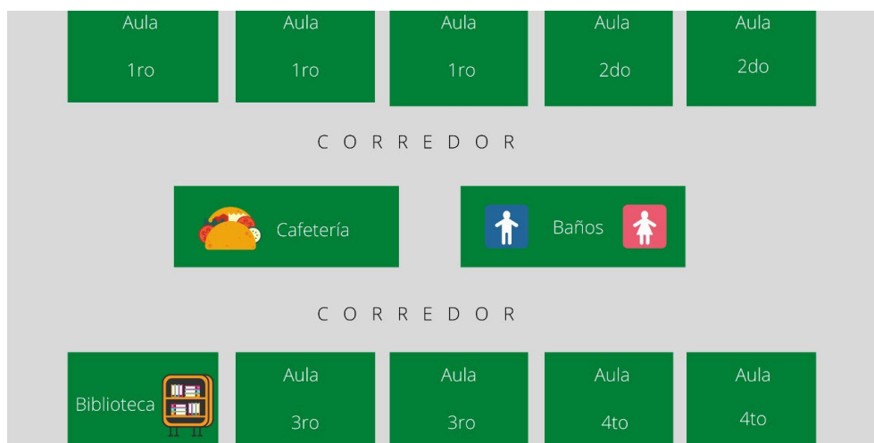
Figura 2. Croquis primera planta alta escuela elemental básica