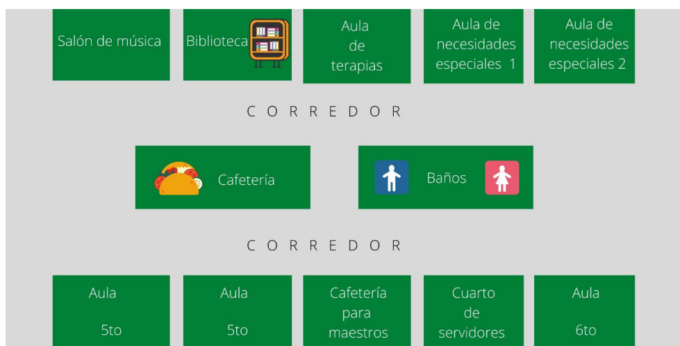
Figura 3. Croquis segunda planta alta escuela elemental básica

Según el organigrama institucional, la directora toma las decisiones macro en el plantel. Después de ella viene el consejero, quien, con especialidad en Manejo de Comportamiento, direcciona las situaciones que se puedan presentar en cuanto a problemas de conducta, especialmente para los estudiantes del bachillerato.