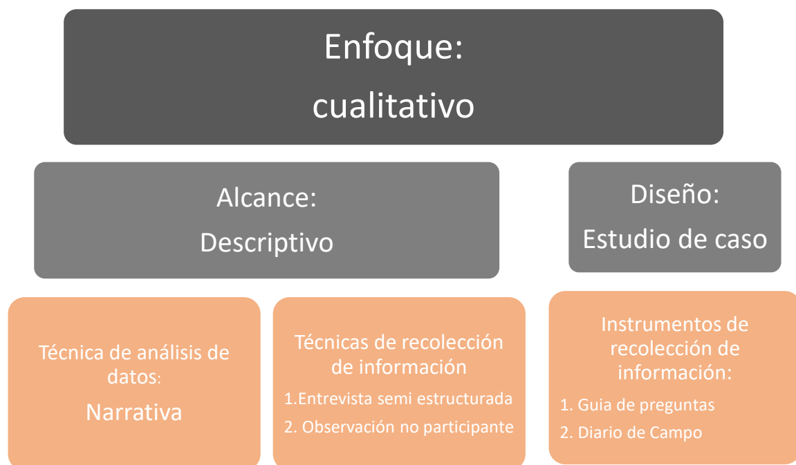
Esquema del Diseño Investigativo